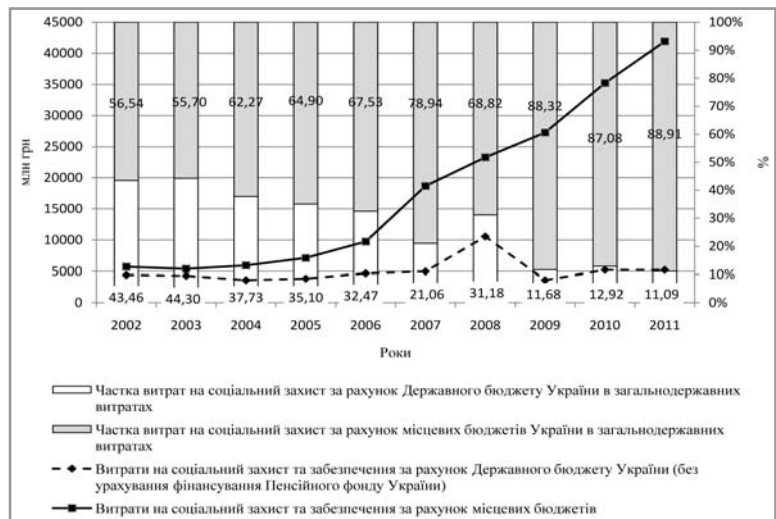
Рис. 2. Динаміка зміни абсолютного та відносного розміру витрат на соціальний захист і соціальне забезпечення за рівними бюджетної системи

З огляду на це на місцевому рівні негайного вирішення, на нашу думку, потребують такі питання: удосконалення міжбюджетних відносин у напрямі збільшення повноважень місцевих органів влади при розрахунку потреби у фінансових ресурсах для соціального захисту населення;