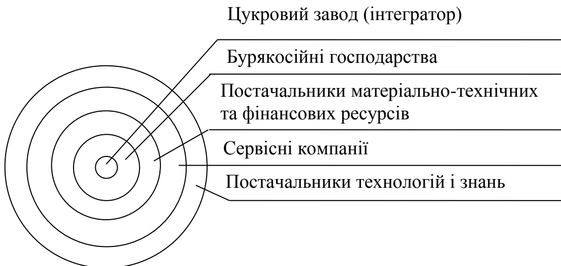
Рис. 1. Архітектура цукробурякового інтегрованого формування

Таким чином, під цукробуряковим інтегрованим формуванням пропонуємо розуміти складну інтегровану економічну систему, створену на базі цукрового заводу шляхом вертикальної та/або горизонтальної інтеграції структур, що забезпечують виробництво цукрових буряків, їх транспортування, переробку, а також зберігання, транспортування та реалізацію цукру (рис. 1).