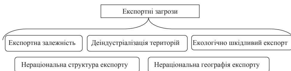
Рис. 1. Систематизація експортних загроз

У 2017 р. номенклатура товарного експорту вітчизняної аграрної продукції становила 43,8% у