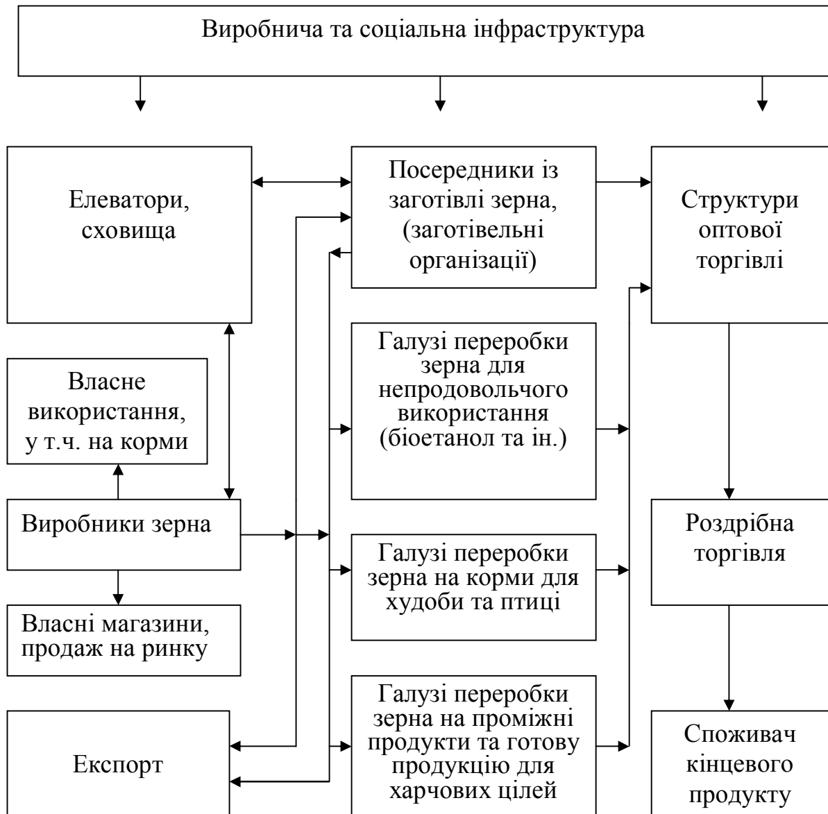
Рис. 1. Схема елементів зернопродуктового підкомплексу АПК