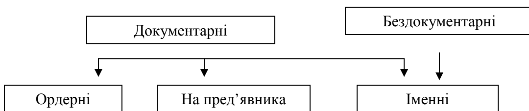
Рис. 2 Класифікація цінних паперів за приналежністю права

При бездокументному способі фіксації майнових прав «права, засвідчувані шляхом вказаної фіксації, порядок офіційної фіксації права і право власників, порядок документального підтвердження записів і порядок здійснення операцій з бездокументарними цінними паперами визначається законом або у встановленому ним порядку» [4].