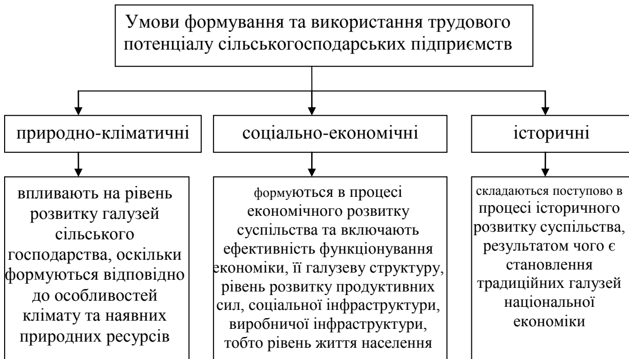
Рис. 1 Умови формування та використання трудового потенціалу сільськогосподарських підприємств

Процес формування та використання трудового потенціалу сільськогосподарських підприємств відбувається при певних умовах, але вони дещо відрізняються від тих умов, що є притаманні іншим галузям економіки. Причиною цього є сама специфіка галузі, а тому й існує залежність трудового потенціалу сільськогосподарських підприємств від природно-кліматичних, соціально-економічних та історичних умов (рис. 1).