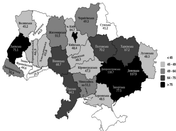
Рис. 2. Чисельність безробітного населення в регіонах України у 2019 р., тис. осіб

Важливо зазначити, що в Черкаській області, спостерігалась 53,1 тис осіб безробітного населення. Варто зазначити, що порівняно з 2019 роком на Черкащині кількість безробітного населення зросла на 4,8 тис. осіб, або майже на 9 % (рис. 2).