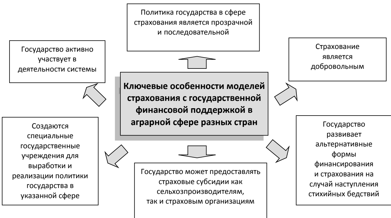
Рис. 4. Особенности моделей страхования с государственной финансовой поддержкой в аграрной сфере в разных странах

участвует в деятельности системы; политика государства в сфере страхования является прозрачной и последовательной; страхование является добровольным; создаются специальные государственные учреждения для выработки и реализации политики государства в указанной сфере; государство может предоставлять страховые субсидии, как сельхозпроизводителям, так и страховым организациям; государство развивает альтернативные формы финансирования, и страхования на случай наступления стихийных бедствий.