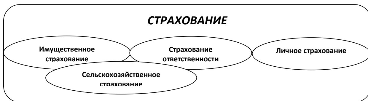
Рис. 1. Место агострахования в общей системе страхования

Итак, сельскохозяйственное страхование – это, прежде всего, система экономических отношений между конкретными субъектами хозяйствования, где с одной стороны выступают страховщики – финансово-кредитные учреждения, а с другой – страхователи – сельскохозяйственные предприятия, арендаторы, крестьянские (фермерские) хозяйства, которые за определенную плату передают свои риски имущественных, финансовых потерь в сельскохозяйственной деятельности с целью получения возмещения при наступлении страхового случая.