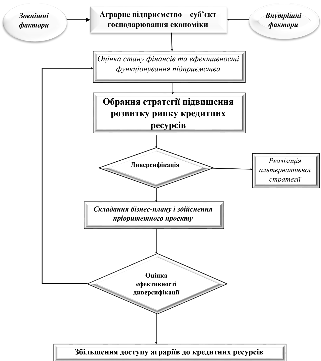
Рис. 3. Алгоритм вибору стратегії диверсифікації суб'єктів господарювання аграрного бізнесу для підняття доступу до кредитних ресурсів [3]

Після вибору відповідної стратегії відбувається її реалізація з подальшим контролем за її ефективністю. У разі високої продуктивності впровадженої стратегії диверсифікації зростає доступ суб'єктів господарювання аграрного бізнесу до ринку кредитних ресурсів. Управління диверсифікаційними процесами можна описати як систему прийняття рішень та виконання дій, спрямованих на використання найбільш перспективних можливостей для розширення діяльності суб'єктів господарювання в аграрному бізнесі. Це означає