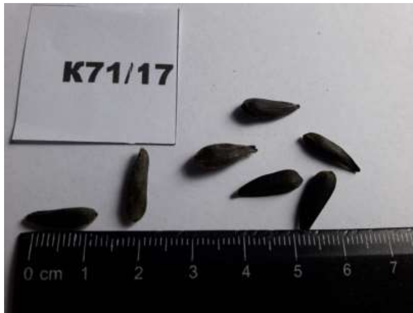
Рис. 4. Насіння лінії-закріплювача стерильності соняшнику кондитерського напрямку використання K1302/17

Форма сім'янки видовжена. Смугастість на краях та між краями відсутня. Плямистість перикарпію відсутня.