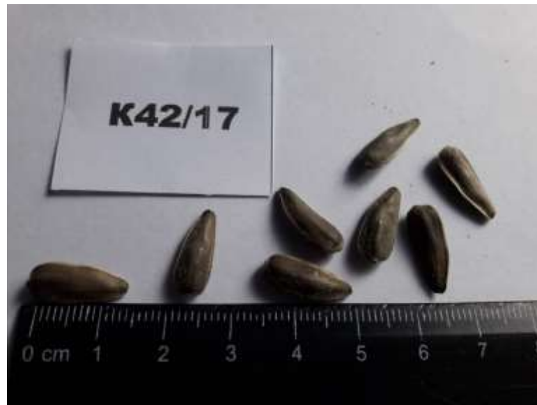
Рис. 3. Насіння лінії-закріплювача стерильності соняшнику кондитерського напрямку використання K1617/17

Лінія закріплювач стерильності K1302/17 характеризується середнім розміром листка із слабкою пухирчастістю. Вушка малі. Зубці помірні. Форма у поперечному розрізі – плеската. Форма верхівки листа – загострена. Крила листка слабо виражені. Кут між найнижчими бічними жилками гострий. Висота верхівки листка знаходиться на рівні з місцем прикріплення листкової пластинки. Опушеність верхівки стебла сильна. Вегетаційний період 130 днів. Форма зовнішніх листків обгортки чітко округлі з короткою верхівкою. Рослини висотою 180 \pm 5 см. Кошик плескатої форми, має діаметр 25,8 \pm 4 см, розміщений перпендикулярно за відношенням до прямого стебла.