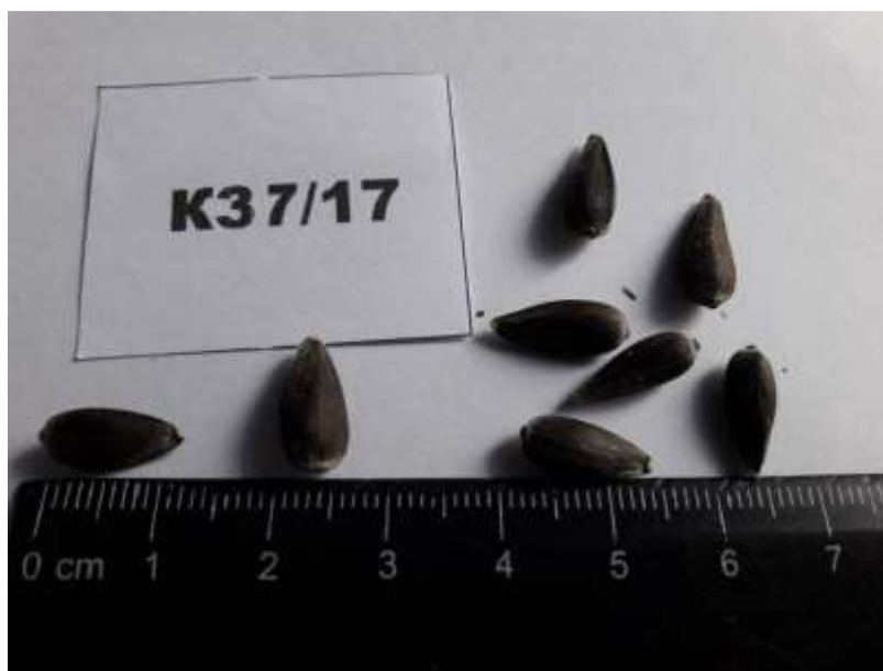
Рис. 2. Насіння лінії-закріплювача стерильності соняшнику кондитерського напрямку використання K269/17.

У лінії-закріплювача стерильності K1617/17 спостерігається зелене забарвлення гіпокотилію. Листок за розміром малий з помірною інтенсивністю зеленого забарвлення. Гофрованість листкової пластини слабка. Вушка помірні. Зубці дрібні. Форма у поперечному розрізі – сильно увігнута. Форма верхівки листа – загострена. Висота верхівки листка вища місця прикріплення листкової пластинки. Опушеність верхівки стебла сильна. Вегетаційний період 100 днів. Язичкові квітки помірної щільності, оранжево-жовті. Трубочасті квітки за кольором оранжеві. Антоціанове забарвлення приймочки помірне. Форма зовнішніх листків обгортки чітко видовжена. Верхівка довга. Рослина висотою 125 \pm 4 см. Положення кошика – напівобернений донизу із зігнутим стеблом. Кошик діаметром 28,6 \pm 3 см. Форма кошика – плеската.