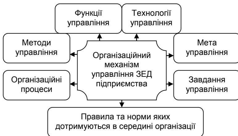
Рис.1. Організаційний механізм управління підприємством*

Ми поділяємо погляди О. Гавриляк, який стверджує, що організаційний механізм управління діяльністю підприємства – це сукупність організаційних складових у механізмі управління (мета та завдання управління, функції та технології управління, методи управління, норми та правила, організаційні процеси), що мають організаційне регулювання, управління в інтересах підприємства, ефективну діяльність управлінської системи (рис. 1) [4].