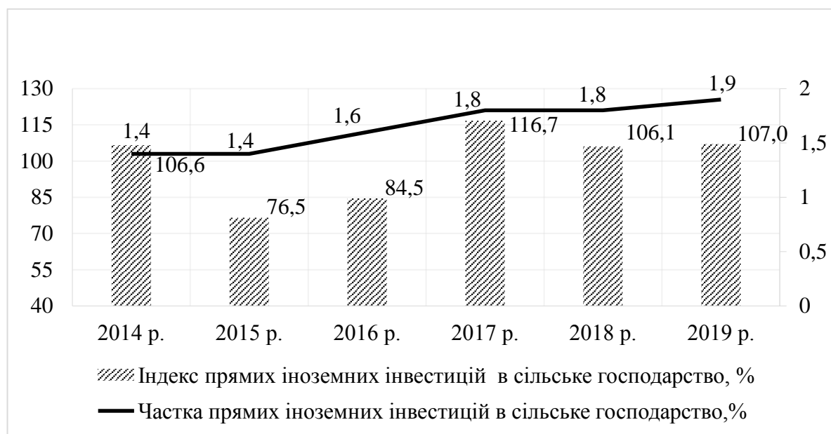
Рис. 2. Динаміка індексу прямих іноземних інвестицій в сільське господарство та їх частка в Україні в 2014–2019 рр.

господарських комплексів аграрного сектора економіки протидіяти дестабілізуючим впливам загроз і забезпечувати підтримку процесів економічного зростання в умовах негативних соціально-економічних тенденцій розвитку національної економіки та держави в цілому 3 . Важливим індикатором інвестиційної привабливості секторів національної економіки є зацікавленість ними з боку іноземних інвесторів (рис. 2).