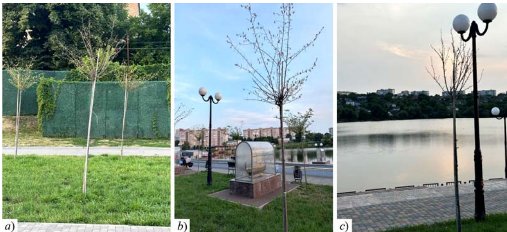
Рис. 3. Приклади висихання насаджень у парку ім. Т. Шевченка / Examples of drying out of plantings in Taras Shevchenko Park