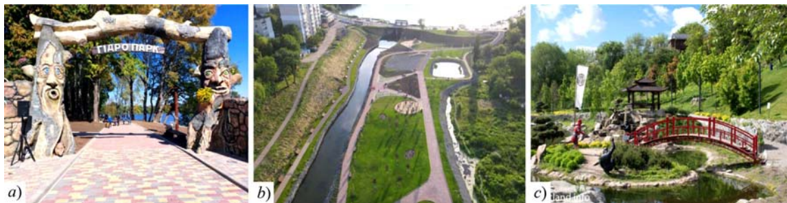
Рис. 1. Нові рекреаційні зони м. Умань / New recreational areas in Uman: a) "Гідропарк" / Hydropark; b) екопарк "Хашці" / Khashcha Ecopark; c) фентезі парк "Нова Софіївка" / Nova Sofiyivka Fantasy Park

Встановлено, що у парках ім. Т. Шевченка, "Центральному" та "Молодіжному" після проведеної реконструкції було розширено асортимент рослин впровадженням у композицію інтродуцентів. У екопарку "Хашці" більшість рослин становлять інтродуценти (75,4 %), штамбові та плакучі форми. На об'єктах рекреації, які побудовані на підставі наявних насаджень у парках "Нова Софіївка" та "Гідропарк", частка інтродуцентів становила 54,7 та 36,1 % відповідно (табл. 1).