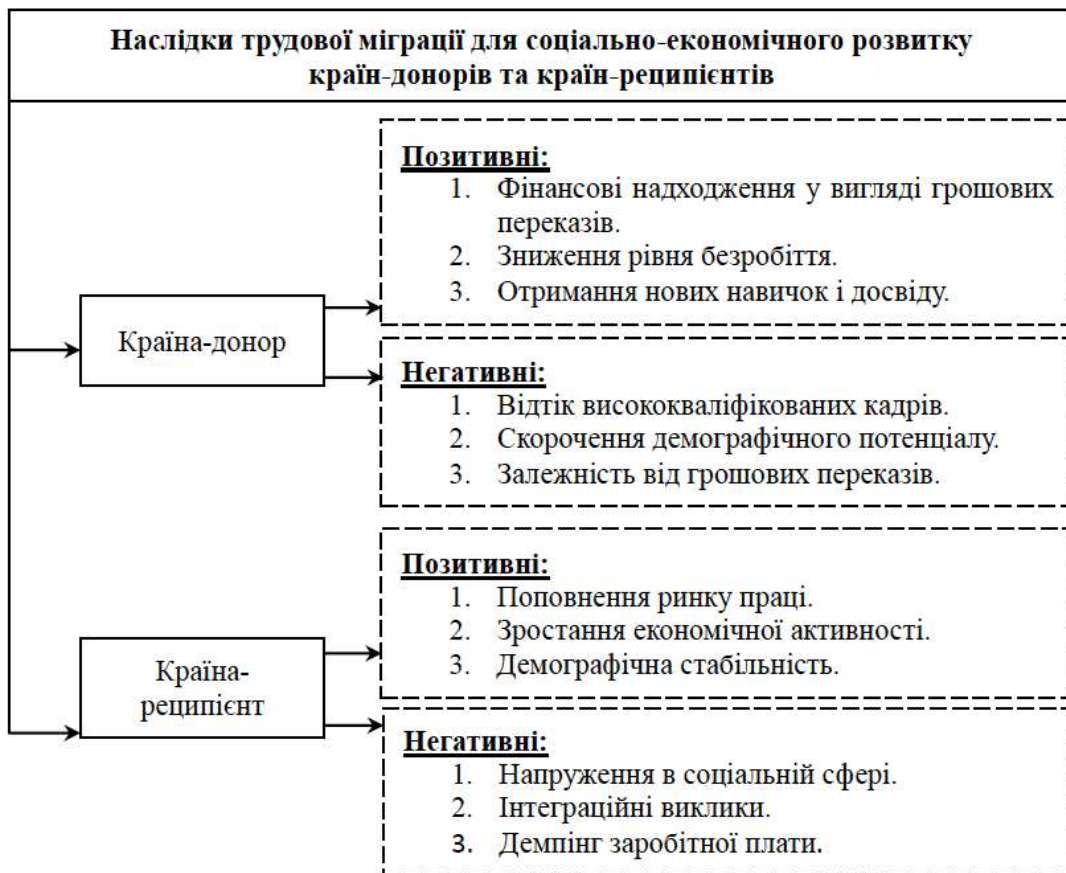
Рис. 2. Наслідки трудової міграції для соціально-економічного розвитку країн-донорів та країн-реципієнтів

яка є основним рушієм інновацій, загрожує довгостроковій конкурентоспроможності країн-донорів.