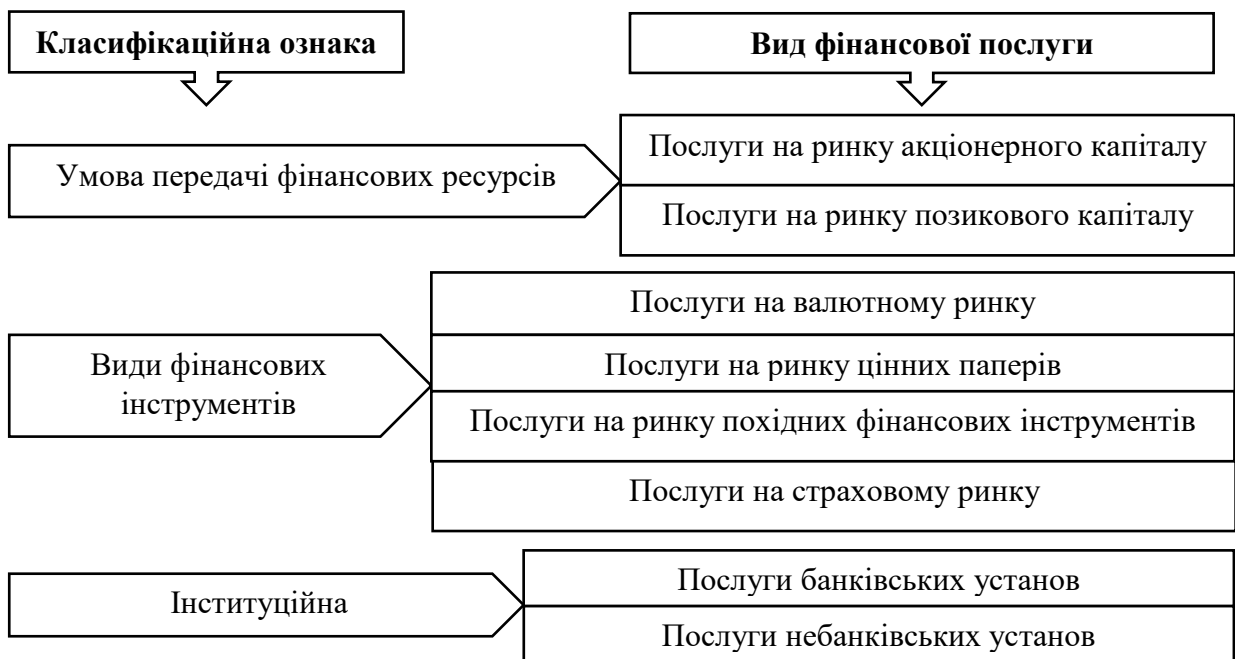
Рис. 2. Класифікація фінансових послуг на фінансовому ринку

Відтак, згідно класифікації, під час надання фінансових послуг на ринку акціонерного капіталу фінансові посередники забезпечують вкладання ресурсів одних суб'єктів у діяльність інших без вказаних дедлайнів. Разом з цим інвестор отримує право на одержання дивідендів, право на спільну власність на активи підприємства. Послуги на ринку позикового капіталу реалізуються за допомогою боргових цінних паперів, а фінансові посередники забезпечують передачу ресурсів на чітко визначений термін під відсотки. До таких фінансових операцій відносять надання грошей у позику кредитно-фінансовими установами, фінансовий лізинг, надання гарантій та поручительств.