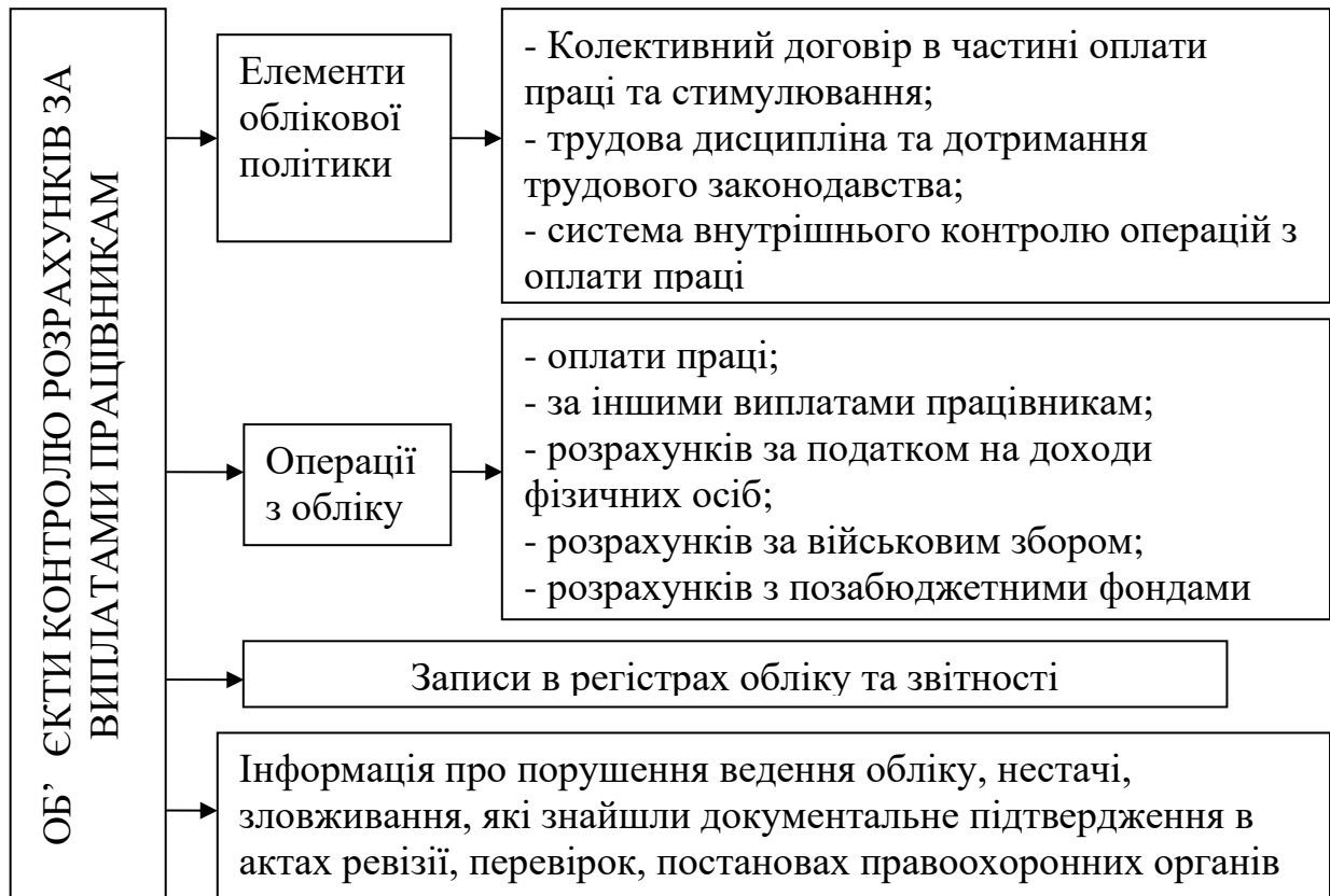
Рис. 2. Об'єкти аудиту розрахунків за виплатами працівникам

обліку, фінансовій звітності, а також загальну оцінку діючої системи формування інформації щодо оплати праці та інших виплат працівникам, їх відповідність законодавчим і нормативним актам, доцільним є здійснення внутрішнього аудиту даної ділянки обліку. Предметом аудиту праці та її оплати, інших виплат є господарські процеси та операції, пов'язані з розрахунками за виплатами працівникам, а також відносини, що виникають при цьому на підприємстві та за його межами. З метою забезпечення належного внутрішнього аудиту та досягнення мети його проведення необхідно чітко сформулювати об'єкти аудиту (рис. 2).