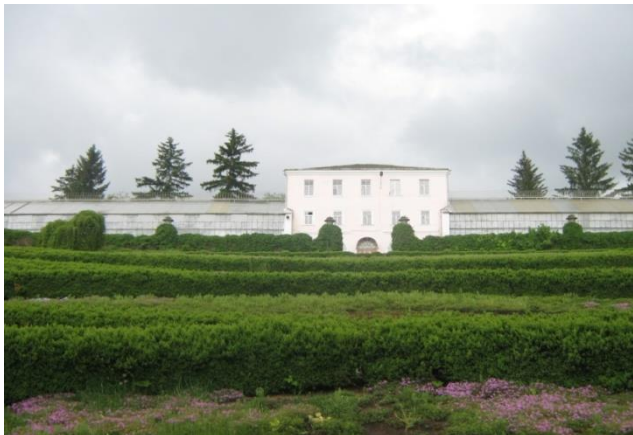
Рис. 3. Загальний вигляд з території НДП «Софіївка» НАН України, 2009 р.