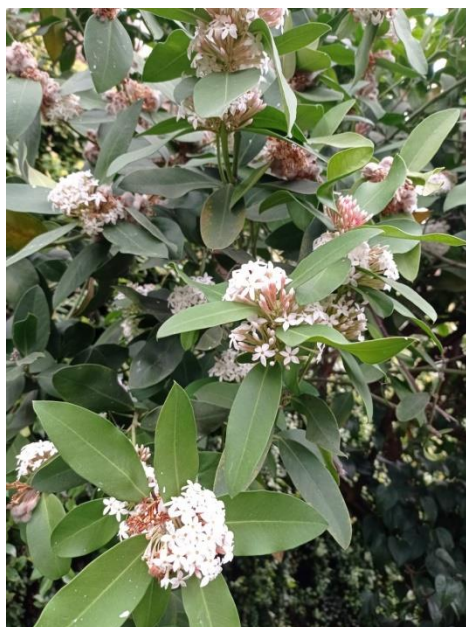
Рис. 4. Acokanthera oppositifolia в теплиці університету.

Мета нашої роботи: вивчити види-екзоти із родини Аросунасеае Juss., історію їх походження, умови вирощування, розмноження, бережне використання.