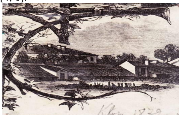
Рис. 2. Виконана гравюра додаткових теплиць, 1879 р.

Слід відмітити, за опрацьованими фото історичних архівних матеріалів музею університету, літературних джерел стародруків бібліотеки зі звітності, каталогів із вирощування та розмноження субтропічних і тропічних рослин, сукулентів, кімнатних, плодових і декоративних у відділах теплично-