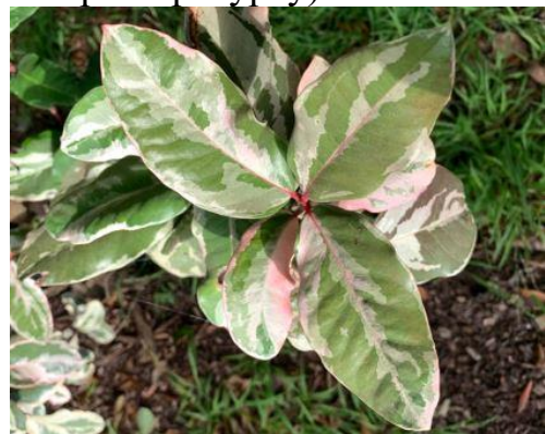
Рис. 5. Acokanthera oblongifolia var. variegata .

Кущ вічнозелений, густий, середнього розміру 2,5 м заввишки, 2 м завширшки, зі шкірястими, видовженими листками, які варієгатні. У період квітвання утворює найкрасивіші грона запашних білих квітів з п'ятьма