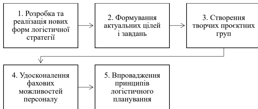
Рис. 1. Схема реалізації інновацій у сферу логістичного менеджменту

Отже, сучасні умови господарювання вимагають впровадження інноваційних підходів у сферу логістичного менеджменту підприємств (рис. 1), а саме: