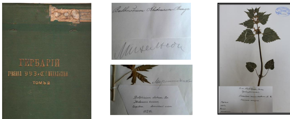
Рис. 1. Зліва-направо: історична папка учня УУЗіС Г. Міхельсона; рукописні етикетки (Міхельсон, Мирошніченко, 1895 р.); гербарний зразок Lamium maculatum L. 1882 р., Й. Пачоський.

У Науковому гербарію (UM) відмічено як в історичній, так і в науковій частині іменні колекції учнів та викладачів навчального закладу (рис. 1, 2).