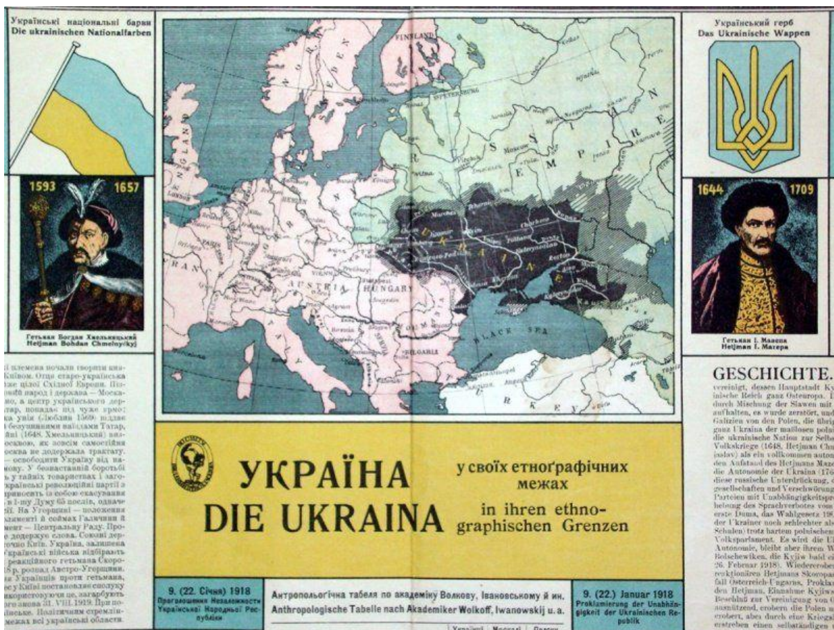
Рис. 2. Віденська карта України 1920 р.

Вагоме історико-правове значення має й «Адміністративна мапа УСРР» (Мапи України різних років), видана в 1922 р. Народним комісаріатом внутрішніх справ квазідержави, проголошеної на теренах УНР. Територію УСРР на ній показано з Таганрозьким і Шахтинським повітами у складі Донецької губернії, що в 1925 р. були передані до Ростовської області РСФРР. Отже, під час утворення наприкінці 1922 р. СРСР, тобто на момент втрати Україною державного суверенітету, зазначені території належали Україні. Цей факт за певних умов може набути істотного міжнародно-правового значення (Кисельов, Кисельова, 2022).