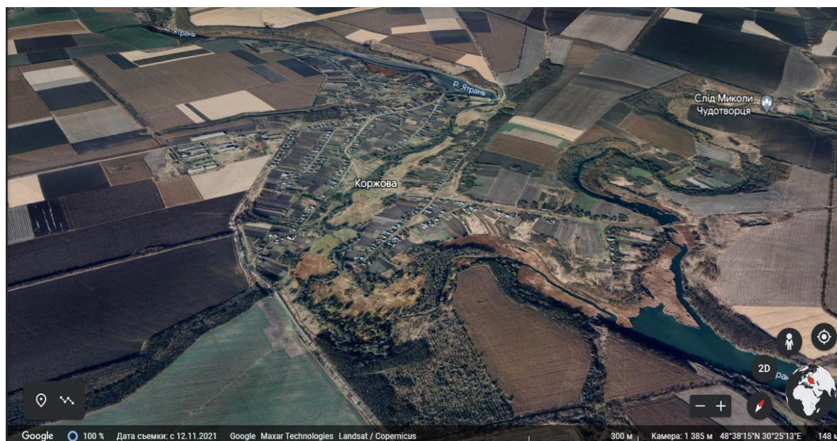
Рис. 1. с. Коржова Уманського району Черкаської області в програмі Google Earth (дата зйомки місцевості: 12 листопада 2021 року)

Село Коржова Уманського району Черкаської області має вигідне географічне положення. Географічні координати: 48°38'45" пн. ш.; 30°24'20" сх. д. Площа досліджуваного об'єкта – 2,5 км 2 . Розташоване у центральній частині України. Знаходиться на південний схід від м. Умані Черкаської області. Відстань до районного центра (м. Умань) становить 21,5 км; до центра ОТГ смт. Бабанка – 16,1 км; до обласного центру (м. Черкаси) – 195 км; до столиці України (м. Київ) – 227 км. На території села проживає 330 осіб. Має високий індекс комунікативності та логістичного сполучення [1,4].