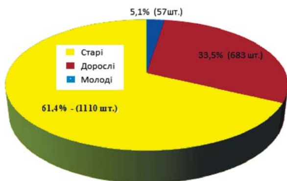
Рис. 2. Співвідношення (%) деревних рослин прибережно-захисної смуги річки Південний Буг на околицях села Ставки за віковими показниками / Ratio (%) by age of woody plants of the coastal protection strip of the Pivdenny Bug River on the outskirts of the village of Stavky

Примітка: * М – молоді рослини; Д – дорослі рослини, що вступили у фазу плодоношення; С – старі рослини, що мають притаманні для цього віку ознаки (сухі гілки, дула, тріщини, відсутність або невелика кількість приростів).