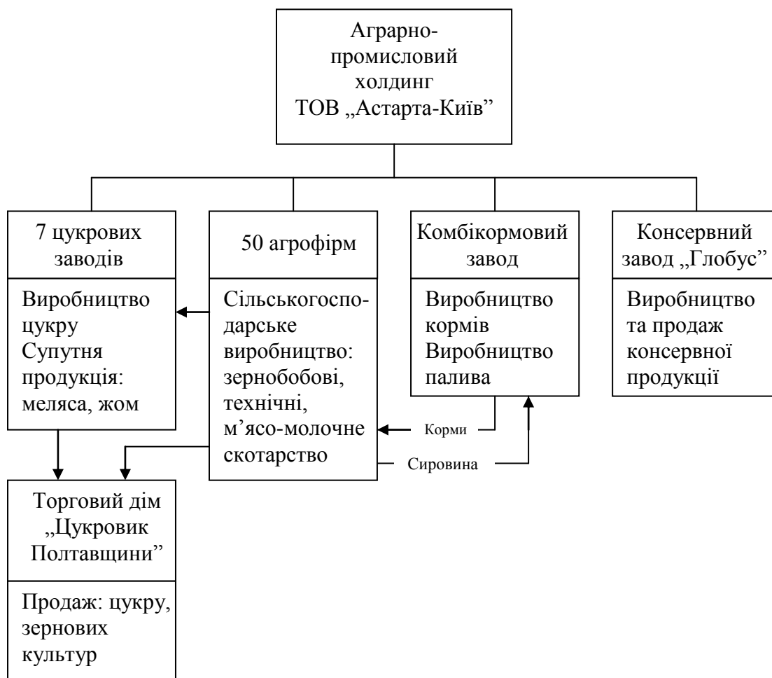
Рис. 1. Організаційна структура аграрно-промислового холдингу ТОВ „Астарта-Київ”

Сьогодні ТОВ “Астарта-Київ” має складну організаційну структуру, що забезпечує замкнений цикл виробництва і реалізації основних видів продукції (рис. 1).