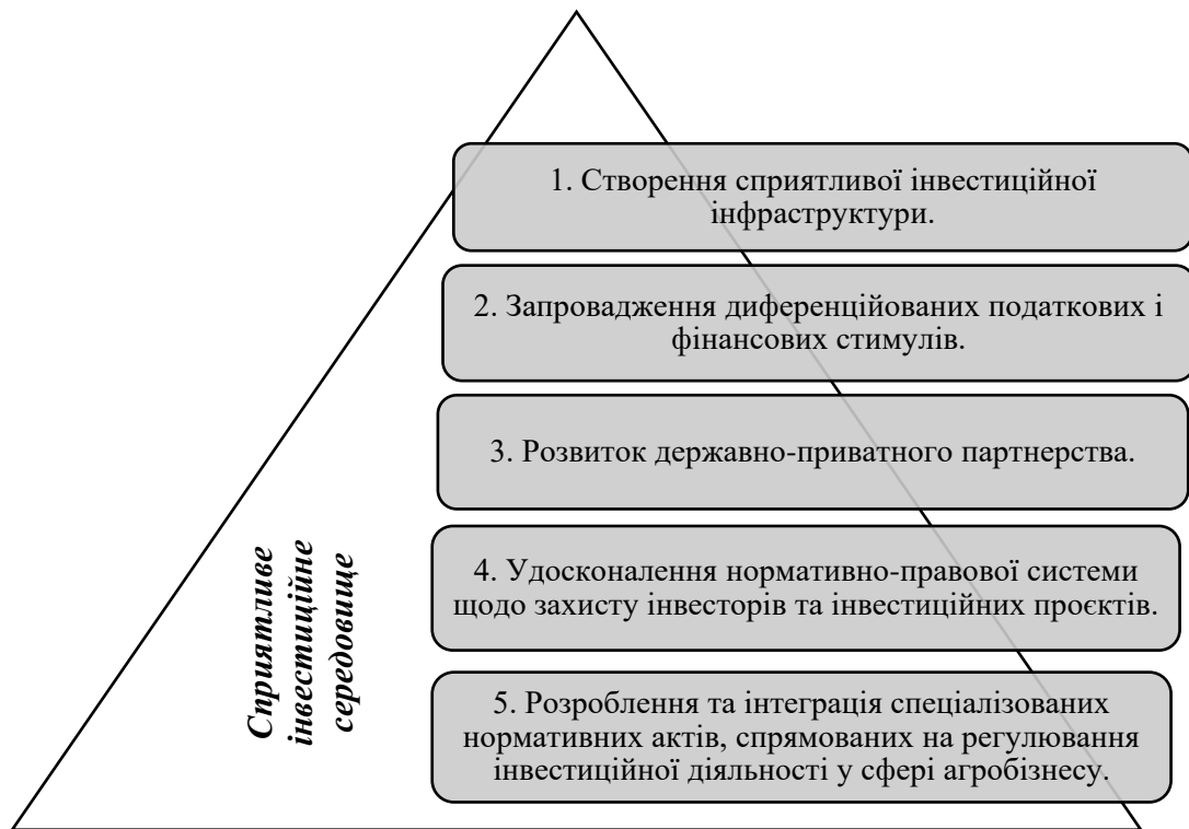
Рис. 2. Основи формування інвестиційного середовища для розвитку малих господарських формувань в аграрному секторі економіки України*

*Джерело: побудовано авторами на основі проведеного дослідження.