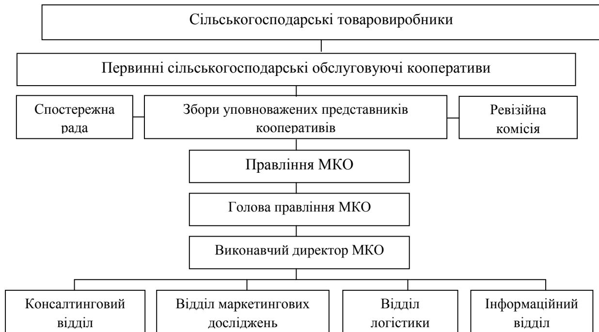
Рис. 2. Проектна структура управління маркетинговим кооперативним об'єднанням

Члени маркетингового кооперативного об'єднання отримують ряд переваг: сильні позиції у проведенні торгових переговорів; можливість формування великих партій продукції; більш професійний маркетинг, який заснований на комплексному дослідженні ринку; доступ до кращих каналів збуту; наявність достовірної інформації про ринок; сильна ринкова позиція замість конкуренції; більш висока якість послуг, економія капіталу і поточних витрат, а також підвищення конкурентоспроможності продукції національного дрібного товаровиробника на міжнародних ринках.