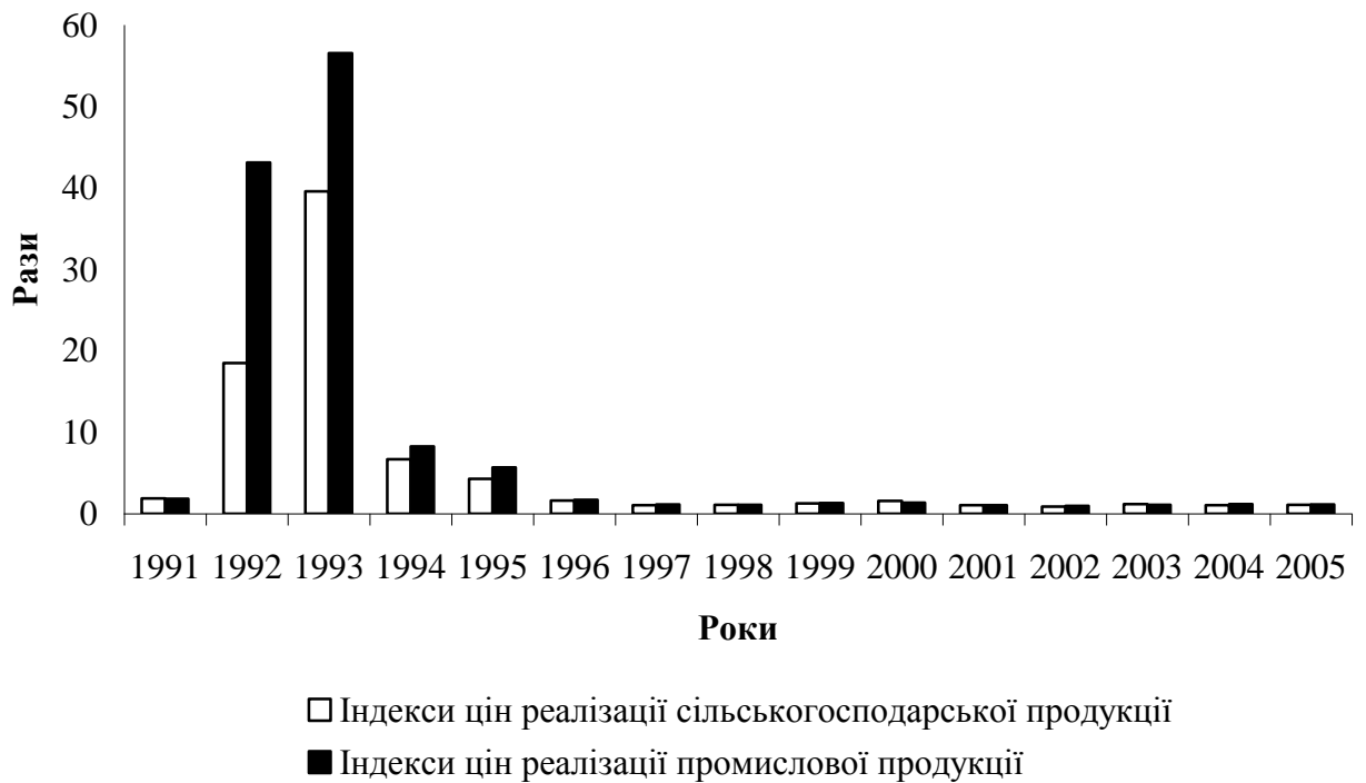
Рис. 1. Зростання цін реалізації продукції сільськогосподарськими підприємствами та цін придбання ними промислової продукції, послуг [3]