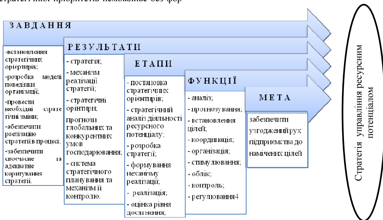
Рис. 1. Елементи стратегічного управління ресурсним потенціалом підприємства

мування елементів стратегічного управління ресурсним потенціалом підприємства (рис. 1).