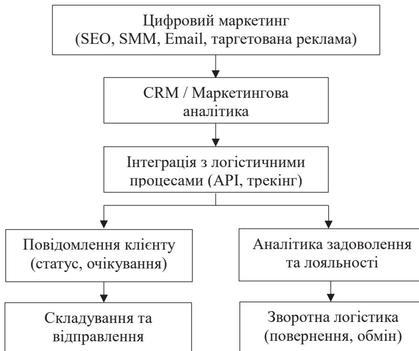
Рис. 1. Модель інтеграції логістичних процесів у цифрову маркетингову стратегію e-commerce

Класичним прикладом глибокої інтеграції логістичних процесів у цифровий маркетинг є Amazon. Преміум-доставка, відома як Prime-доставка пов’язана з брендом Amazon Prime (1–2 дні), подається як конкурентна перевага прямо в рекламних повідомленнях [11]. Вся логістика інтегрована з маркетинговими кампаніями: наприклад, push-нотифікації «Ваш товар щойно залишив склад» підвищують взаємодію з брендом. Через машинне навчання прогнозується попит у певних регіонах, і товари доставляються «на випередження» – що дозволяє швидко виконати замовлення (anticipatory shipping). Результатом є висока лояльність клієнтів, довіра до