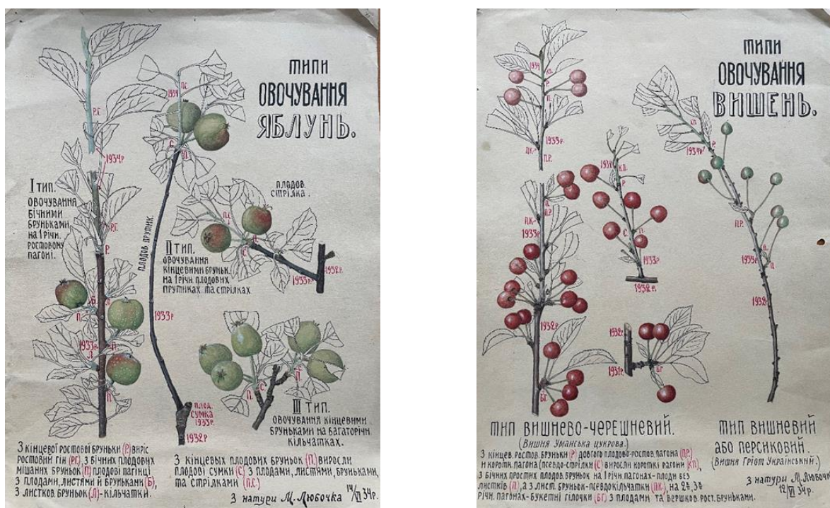
Рис. 4. Таблиці плодових рослин, зображені М. Ф. Любочкою (1934 р.)

фахівцям сільського господарства вивчати садівництво. Прикладом цього є таблиці, які малював Микола Федорович з натури (рис. 4). М. Ф. Любочка мав неабиякий талант до малювання, причому у кольорі. Хоч розміром таблиці були не великими, всього 43×33 см (в країні була нестача паперу), та зображення подавалися в натуральному вигляді й були зрозумілими для студентів.