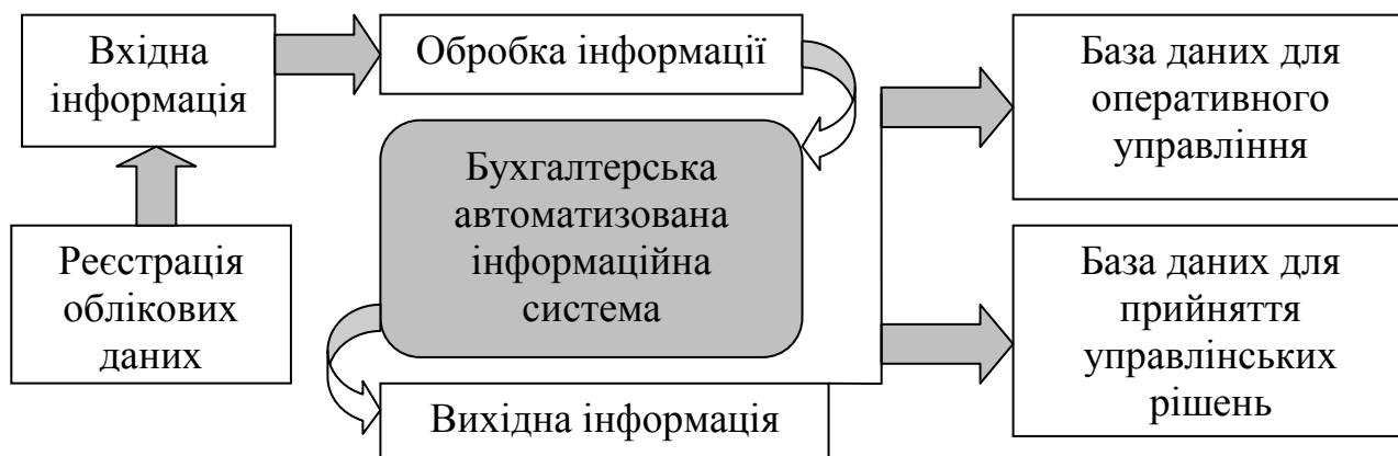
Рис. 2. Бухгалтерська автоматизована інформаційна система

система (БАІС) слугує сполучною ланкою між господарською діяльністю і персоналом, які приймають управлінські рішення (рис. 2).