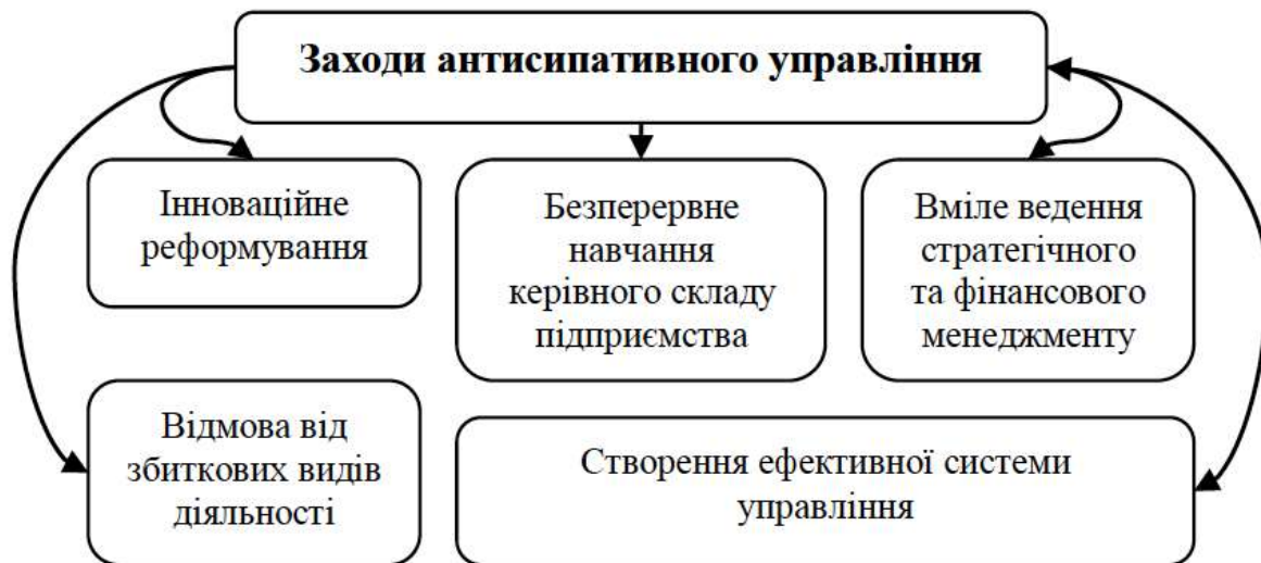
Рис. 3. Випереджувальні антисипативні заходи для аграрних підприємств

стійкості виробників є підтримка їх життєздатності саме через систему випереджальних антисипативних заходів (рис. 3).