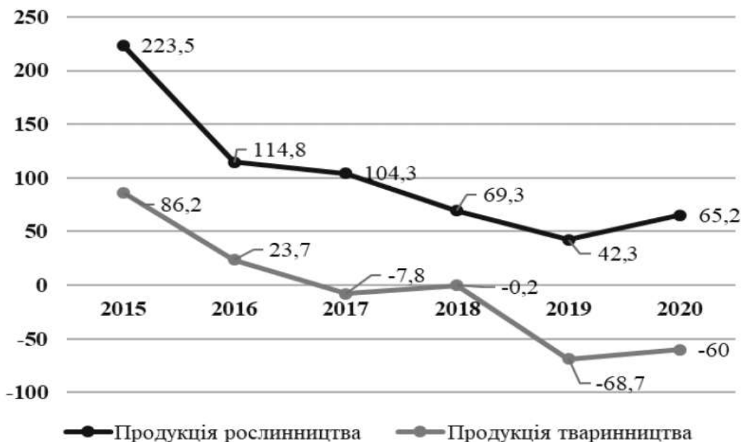
Рис. 1. Рівень рентабельності виробництва аграрної продукції в сільськогосподарських підприємствах, %