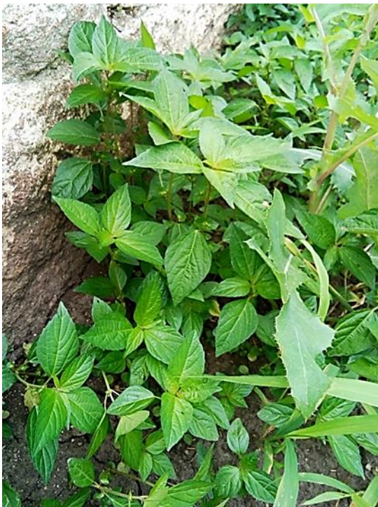
Рисунок 3. Acalypha australis на території Уманського національного університету садівництва, Черкаська область