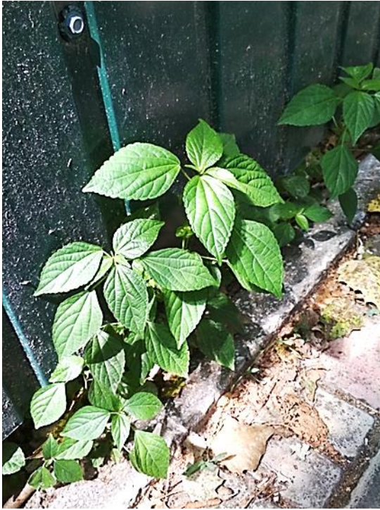
Рисунок 2. Acalypha australis на вулиці м. Скадовськ Херсонської області