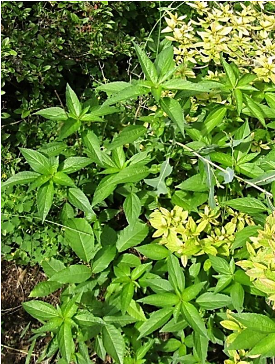
Рисунок 1. Acalypha australis у насадженні рододендронів на території НБС імені М. М. Гришка у м. Київ