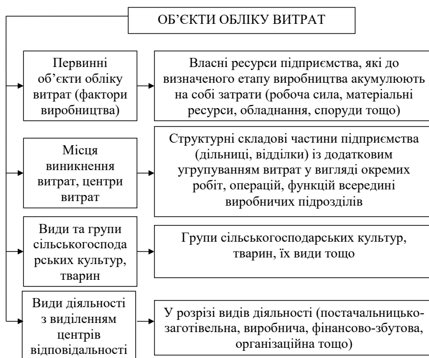
Рис. 2. Групування об'єктів обліку витрат виробництва в системі управління підприємством

В сучасних умовах господарювання для оптимізації процесу виробництва сільськогосподарської продукції внутрішньогосподарський контроль забезпечує зв'язок між керівництвом та безпосередніми учасниками всіх господарських процесів, що відбуваються на підприємстві. Внутрішньогосподарський контроль – це система заходів підвищення ефективності діяльності, яка стосується внутрішніх процесів, що відбуваються на підприємстві, для надання