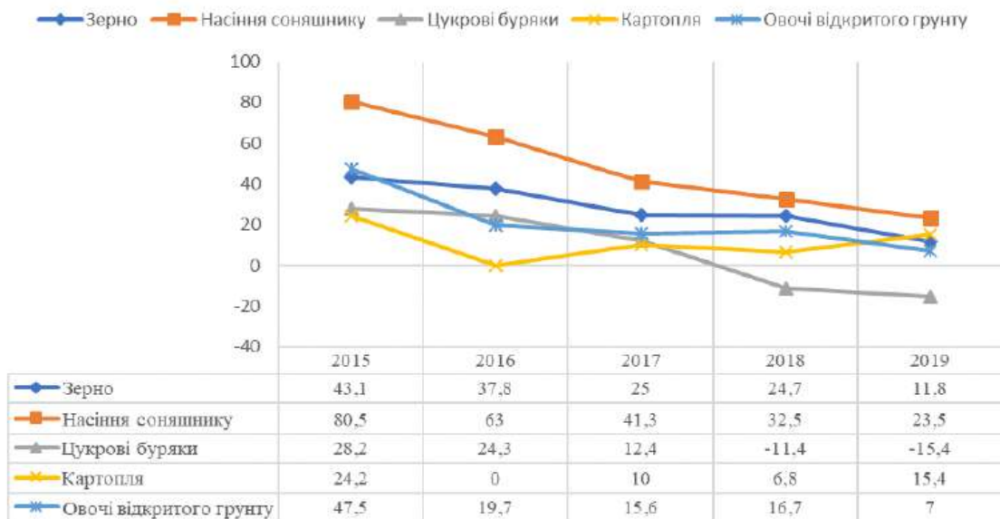
Рис. 1. Рівень рентабельності виробництва продукції рослинництва в сільськогосподарських підприємствах *побудовано автором за матеріалами [4]

Аналізуючи дані, які зазначені на рис.1, можна зробити висновок, що протягом досліджуваного періоду спостерігається різкий спад рентабельності в аграрному секторі.