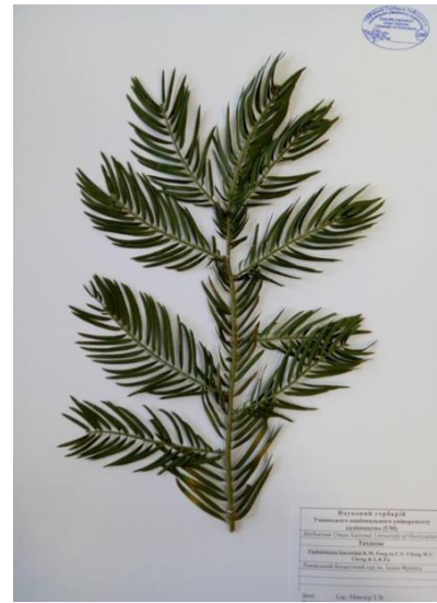
Цефалатаксус ланцетний ( Cephalotaxus lanceolata K.M. Feng ex C.Y. Cheng W.C. Cheng & L.K.Fu)