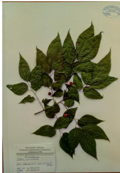
Каркас західний ( Celtis occidentalis L.)