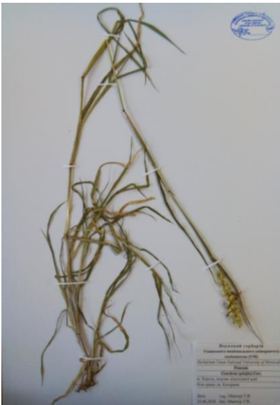
Ценхрус якірцевий ( Cenchrus spinifex Cov.)