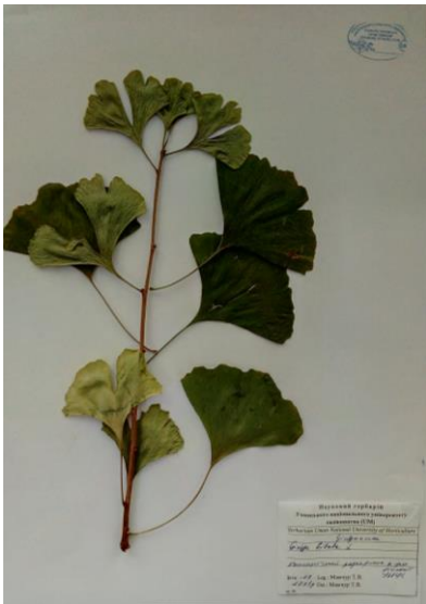
Гінко дволопатеве ( Ginkgo biloba L.)