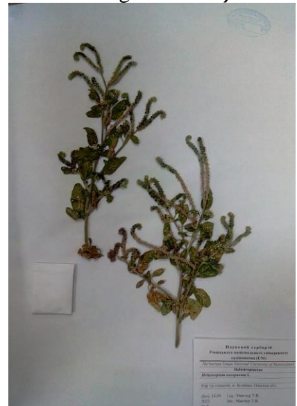
Геліотроп європейський ( Heliotropium europaeum L.)