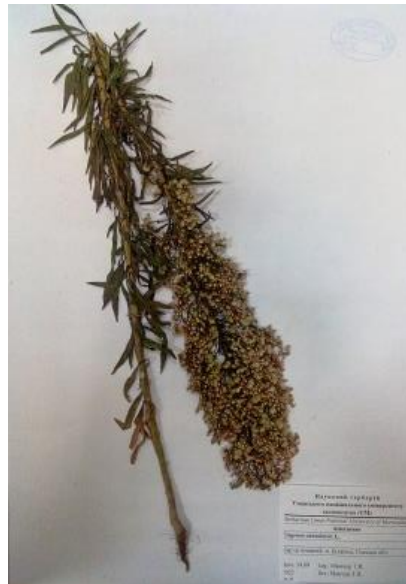
Злінка канадська ( Erigeron canadensis L.)