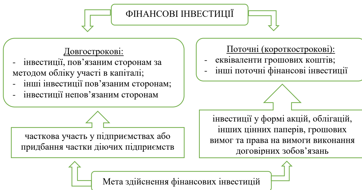
Рис. 1. Бухгалтерська класифікація фінансових інвестицій

Бухгалтерська класифікація фінансових інвестицій забезпечує розмежування їх у часі: довгострокові та короткострокові, для обліку яких планом рахунків бухгалтерського обліку передбачені наступні рахунки: 14 «Довгострокові фінансові інвестиції», 35 «Поточні фінансові інвестиції» (рис. 1).