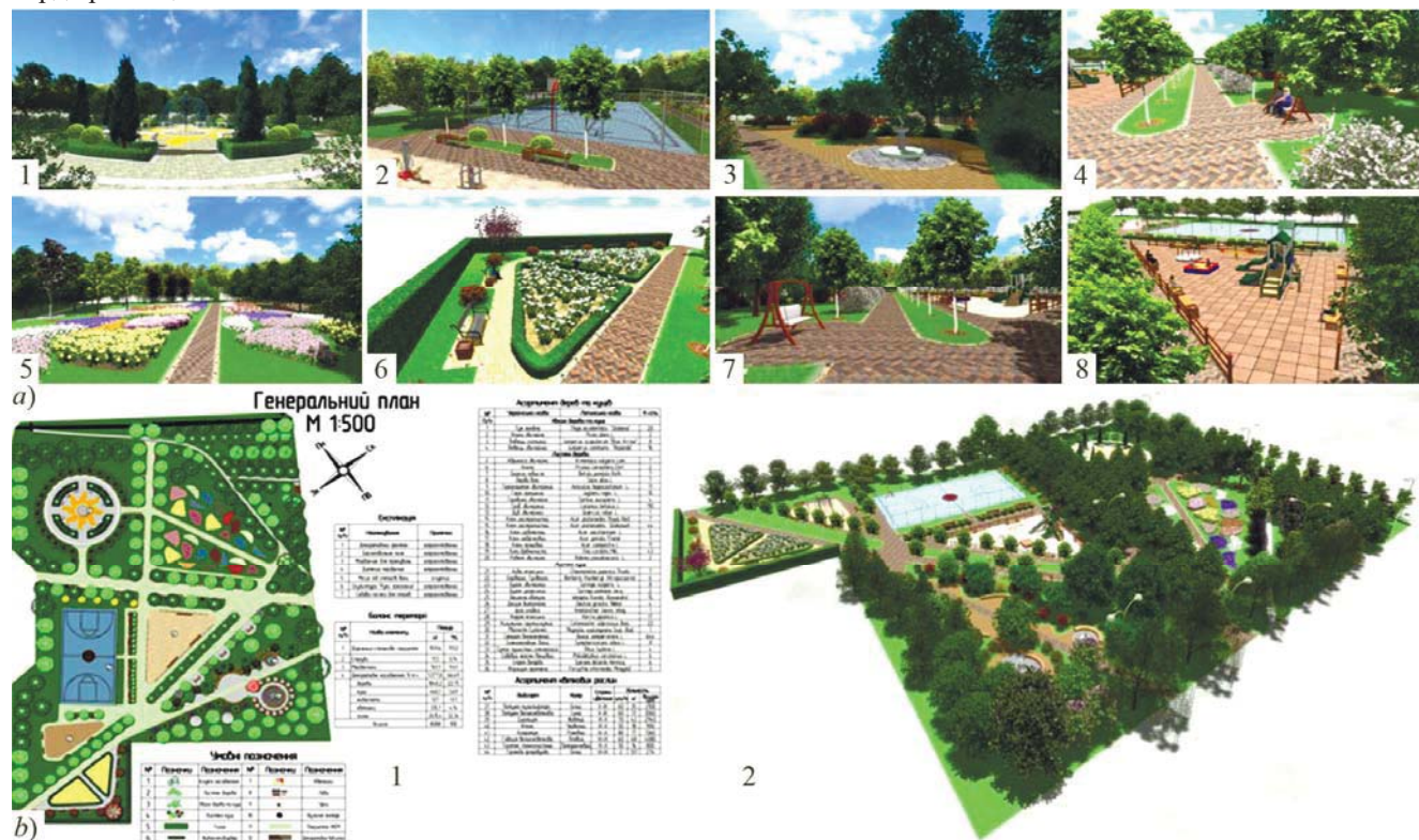
Рис. 4. Генеральний план та візуалізації скверу "Сонячний" / Master plan and visualisation of Soniachnyi Garden Square

Зони тихого відпочинку і прогулянок охоплюють прогулянкові стежки, тихі куточки скверу обладнані підвісними гойдалками-лавками, парковими лавками, скульптурами, фонтанами тощо. Криволінійні доріжки цієї зони запроєктовано для розвантаження транзитних шляхів скверу. Для озеленення цієї зони доцільно використовувати найпривабливіші композиції гарноквіткових та декоративно-листяних порід і квіткових рослин, а саме: клумби, рабатки, солітери, декоративні групи, бордюри тощо.