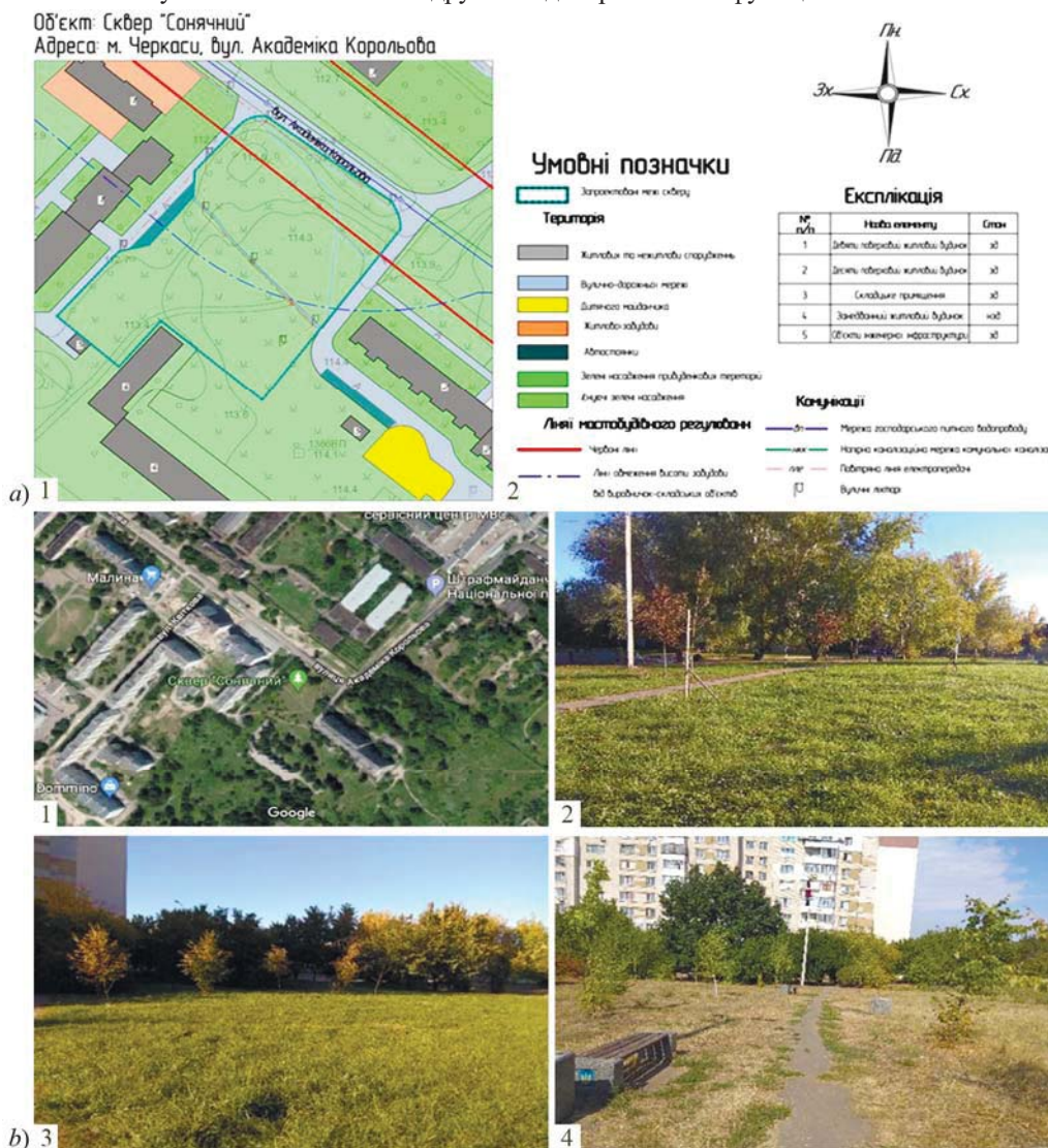
Рис. 1. Сквер "Сонячний" м. Черкаси / Soniachnyi Garden Square in Cherkasy: a) опорний план / reference plan; b) світліни натурного обстеження / photographs of the field survey

рядних доріг. Цей зв'язок вказує натяся рослинністю, яка формує єдиний пейзаж композиції. У комплексі запроєктовані функціональні зони покликані забезпечити оптимальні умови для відпочинку та дозвілля населення, поліпшити стан зелених насаджень, з погляду їх декоративних і функціональних якостей.