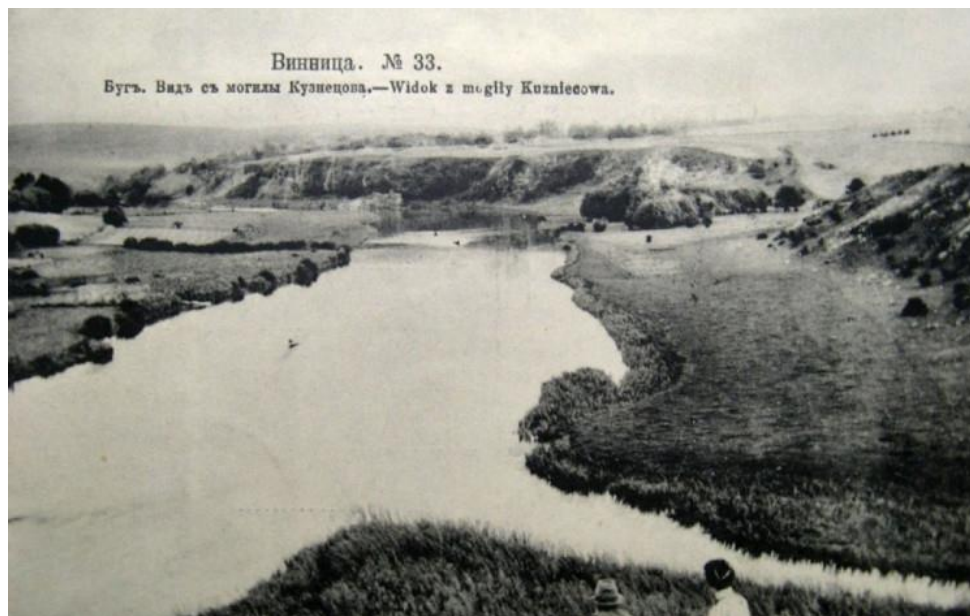
Рис. 3. р. Південний Буг на давньому фото [1]