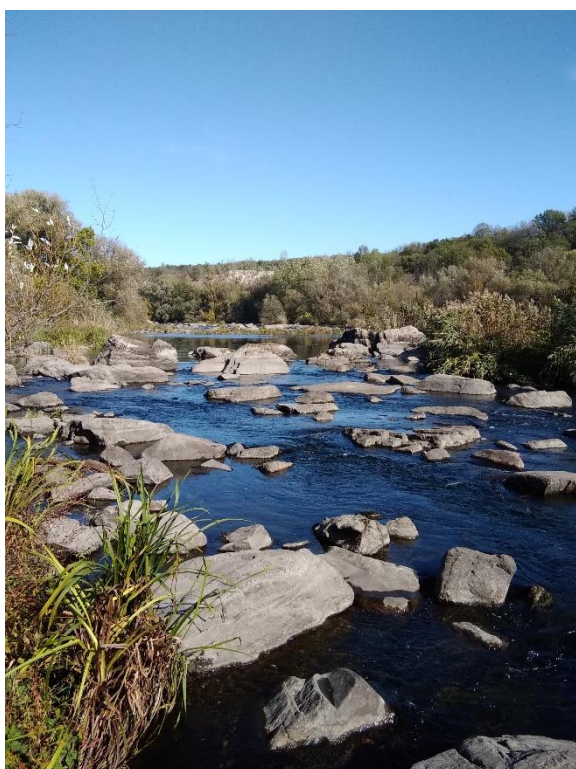
Рис. 4. Пороги в структурі річищного типу місцевостей р. Південний Буг (с. Соломія), 15.10. 2020 р.