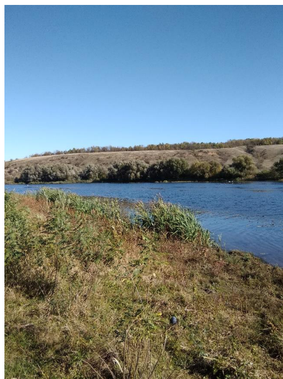
Рис. 5. Вид на р. Південний Буг, 15.10. 2020 р.

Краєзнавці наголошують, що саме Боплан писав про багаторазове перейменування річки. Це р. Гіпаніс за згадками Геродота. У часи панування турків – це р. Ак-су, що перекладається як «Біла вода». Давні слов'яни назвали р. Південний Буг – р. Бог.