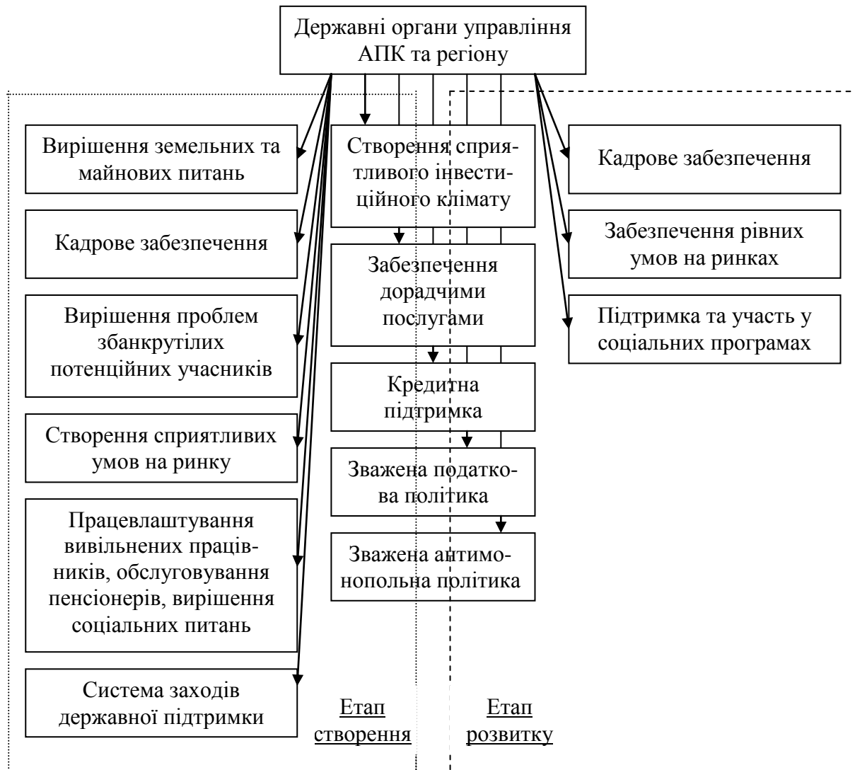
Рис. 1. Схеми державного впливу на інтеграційні процеси в регіоні

через безперебійну роботу комунікаційних мереж: телефону, пошти; електро-, газо, водопостачання; мережі шляхів місцевого, регіонального, державного та міжнародного значення; максимальне соціальне обслуговування населення.