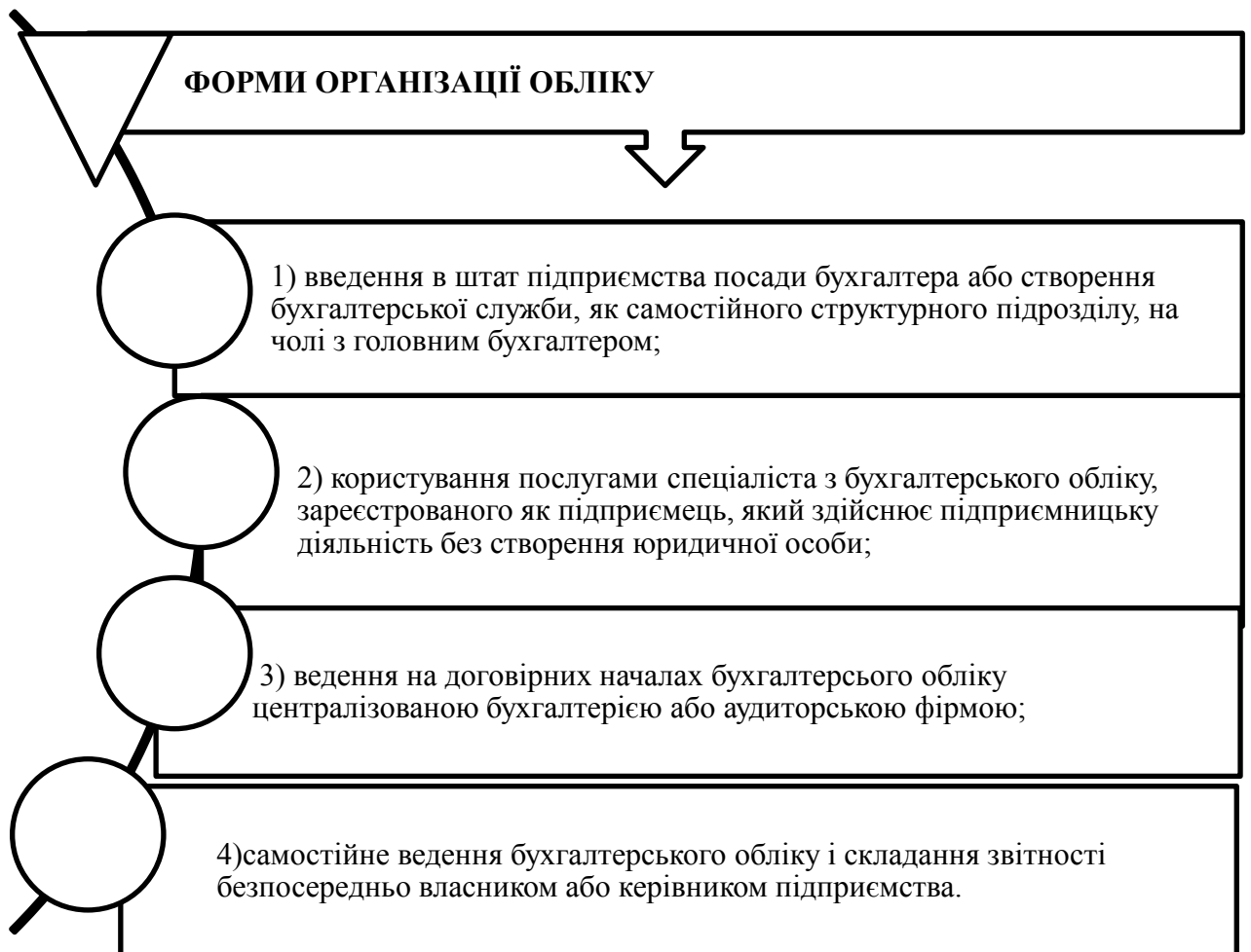
Рис. 2. Форми організації бухгалтерського обліку